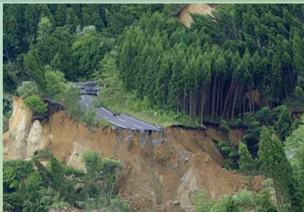
防災支援センター