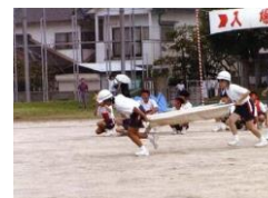
地域の運動会に防災に関係する競技

防災活動に関心を持ってもらうための情報提供 自主防災組織への参加のきっかけとなる取組みが必要