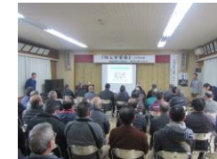
防災講演会の開催