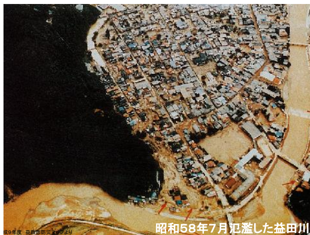
昭和58年7月氾濫した益田川