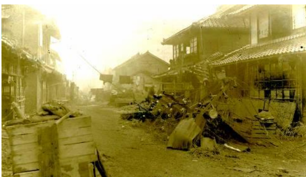
昭和18年9月洪水による益田市街地の被災状況