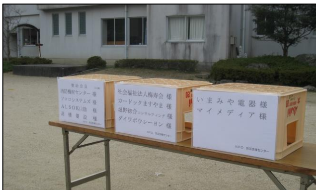
防災訓練会場での賛助会員様紹介の様子