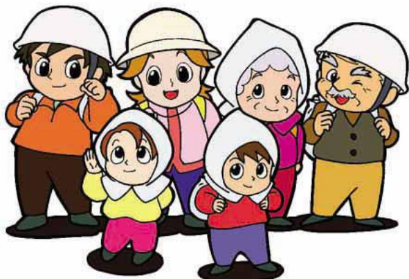
消防庁「自主防災組織の手引」引用