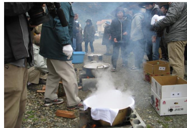
炊き出し訓練の様子